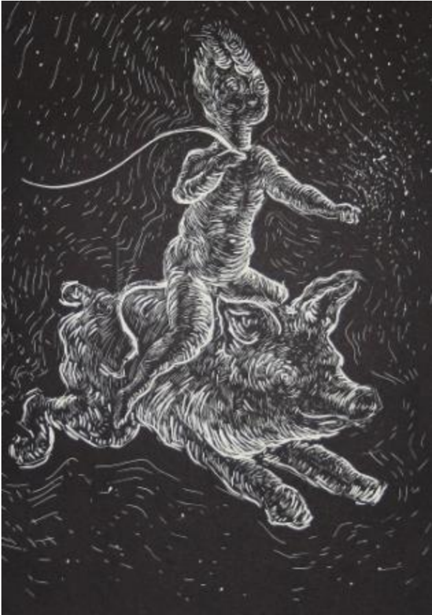
Ulrike Theusner, The King of Inner Devils, 2014, Linolschnitt