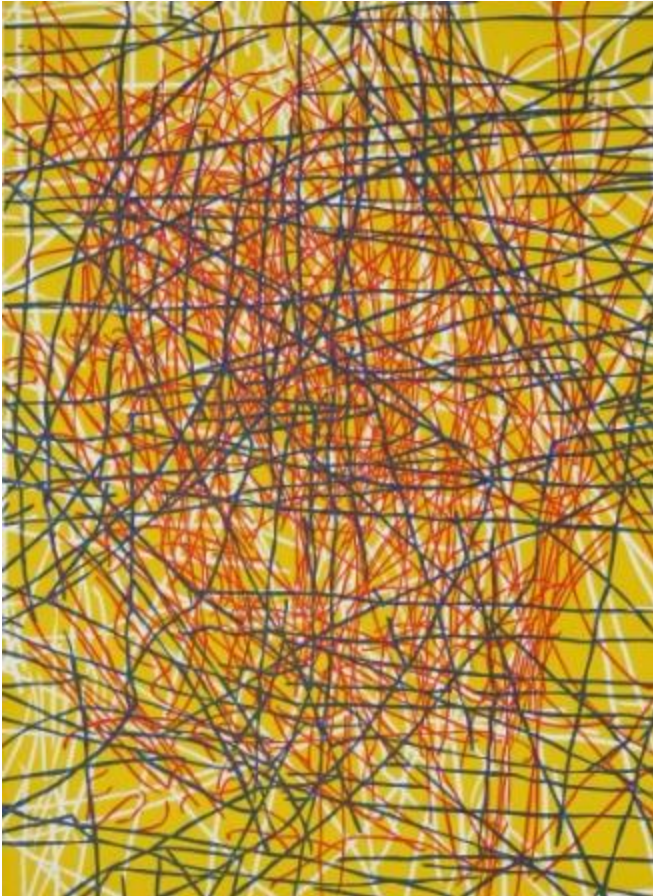
Katharina Immekus, o.T. #1, 2014, Linolschnitt